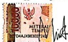
Milenia Fitri Nabilla