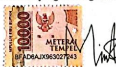
Milenia Fitri Nabilla